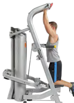
ПОДТЯГИВАНИЯ (С ПОДДЕРЖКОЙ)