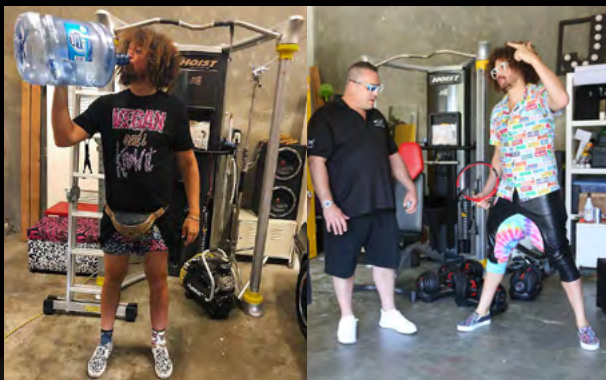
Стефан Горди (Redfoo)