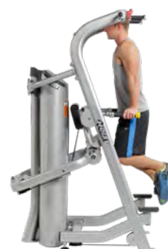
ОТЖИМАНИЯ НА БРУСЬЯХ