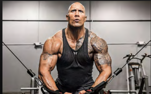
Дуэйн Джонсон (The Rock)