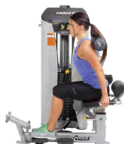
НИЖНЯЯ ЧАСТЬ СПИНЫ