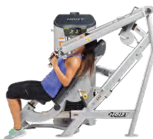
ЖИМ ОТ ГРУДИ