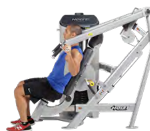
ЖИМ ОТ ПЛЕЧ